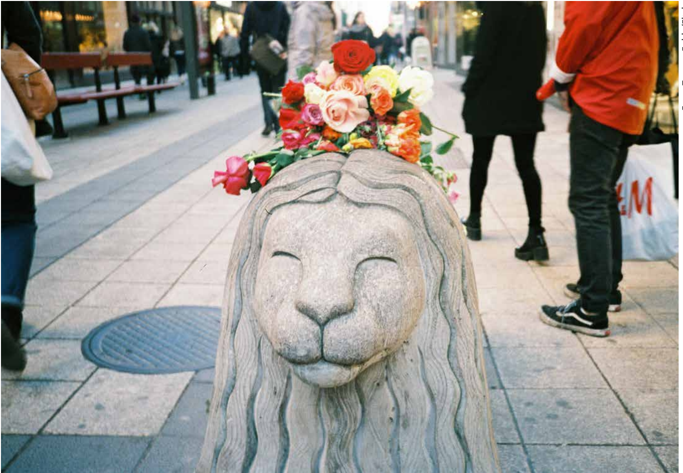
Terrordåd är exempel på en "extraordinär händelse" som påverkar arbetsmiljön för många. Bilden är från dagen efter terrorattacken på Drottninggatan.